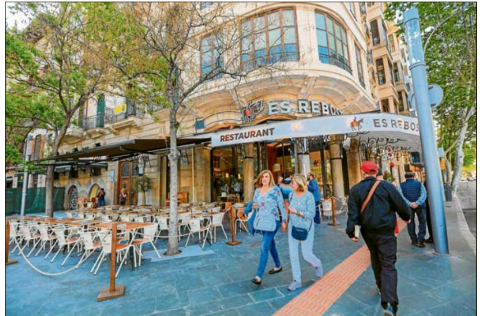
Los paseantes de plaza de España preguntaban cuándo abriría el nuevo local. GUILLEM BOSCH